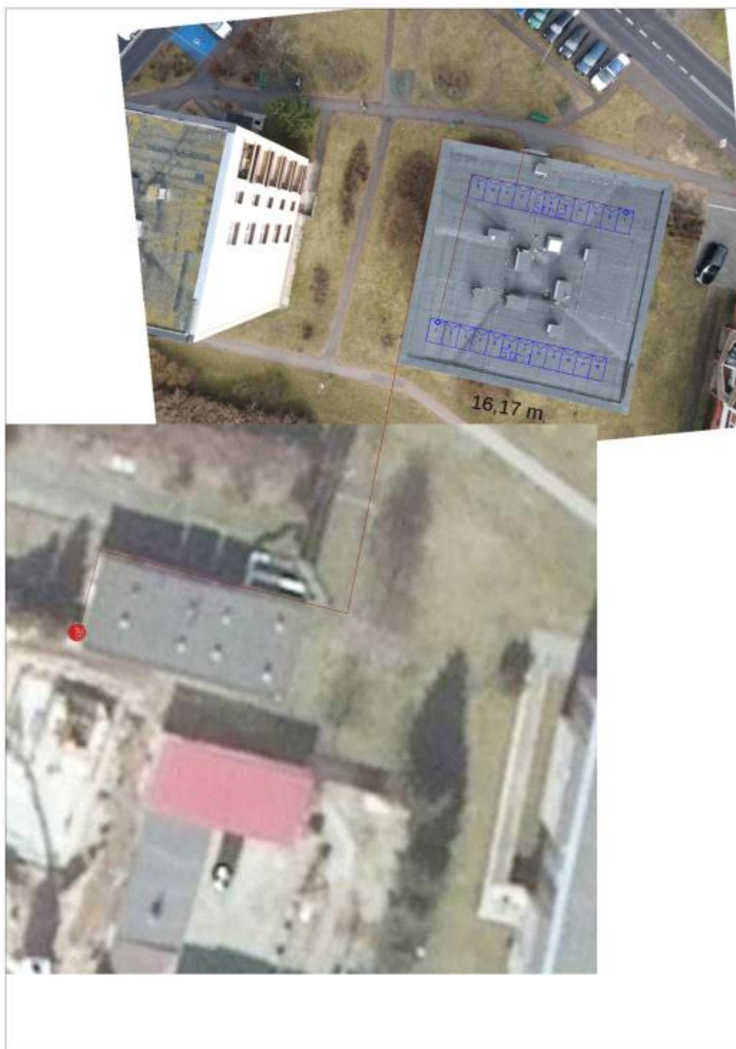
Figura 2: Umieszczenie generatora fotowoltaicznego i grupy konwersji